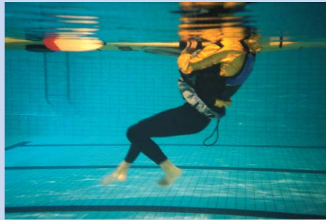
Ligg ved kajakken og ta tak i padleåren.