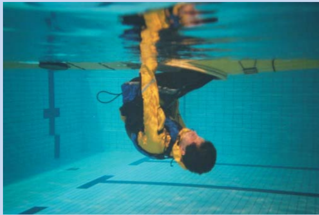
Skyv deg forsiktig ut.