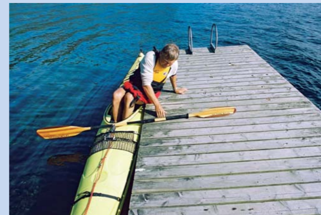
Ombordstigning fra brygge.