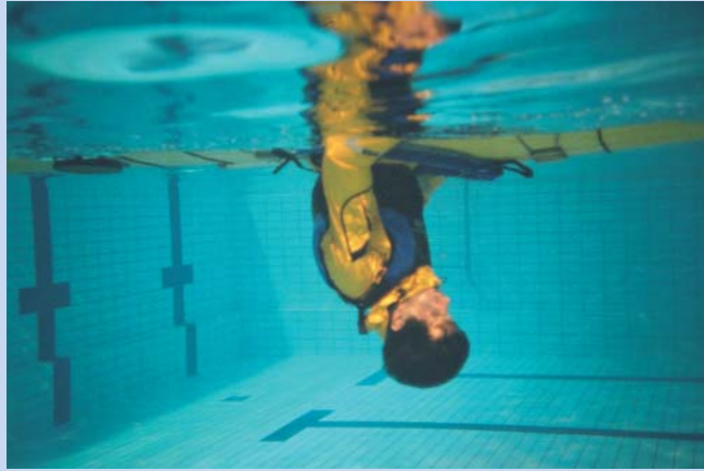
Velt. Du henger opp ned.