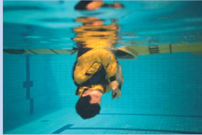
Ta tak i stroppen.