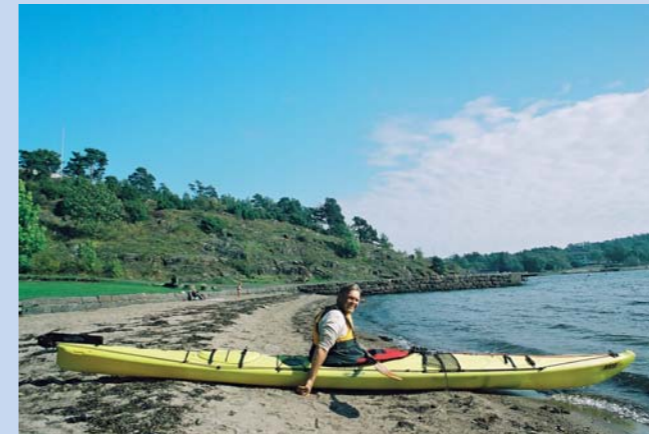
Slik sjøsetter du kanoen fra stranda.

Har kajakken din en ganske stor cockpit, kan du bruke en metode der du ikke trenger åren som hjelp. Legg kajakken på vannet, og stå over den med ett ben på hver side. Sett rumpen ned i cockpitpiten, og trekk først det ene, og så det andre ben oppi. Voila! Kan brukes fra brygger eller steiner også.